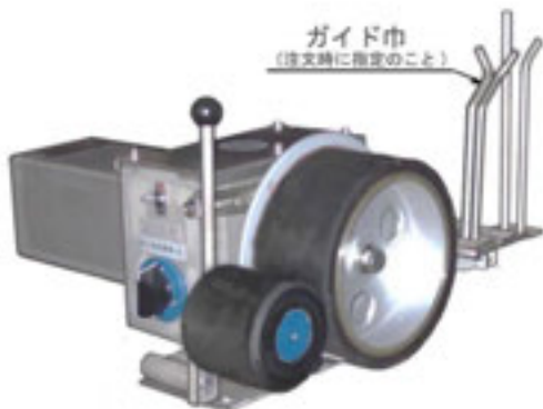
写真は右仕様機です。