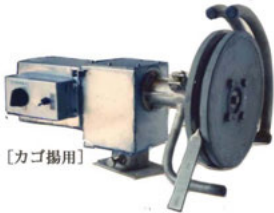
写真は右仕様機です。

[ 漁船協会の型式認定機種です。国の無利子資金や近代化資金の借入利用が出来ます。申請希望の方は手続きの説明書や、書類に添付するカタログを用意していますので販売店に御用命ください。 ]