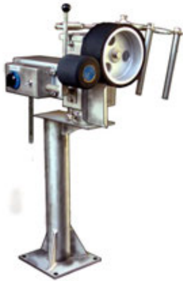
写真は右仕様機です。