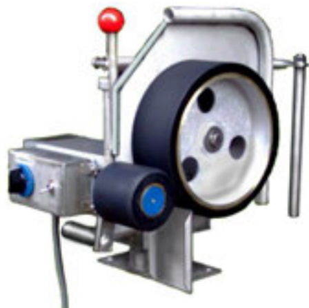
写真は右仕様機です。

[ 漁船協会の型式認定機種です。国の無利子資金や近代化資金の借入利用が出来ます。申請希望の方は 手続きの説明書や、書類に添付するカタログを用意していますので販売店に御用命ください。 ]