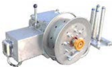
写真は右仕様機です。